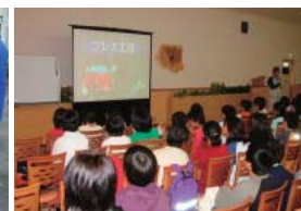
地域貢献活動として小学生を対象にした事業所見学会を実施。