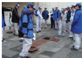
環境事故対応訓練の様子。

また2004年度からは、地域貢献活動の一つとして「小学生対象事業所見学会」を開催しています。2006年度には近隣の小学校5校(5年生410名参加)を対象に開催しました。