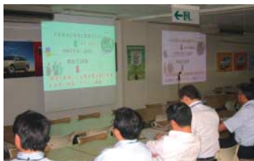
環境関連改善事例発表会の模様。