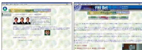
イントラネットの環境教育画面。

当社では、ボランティア活動にも積極的に取り組んでいます。当社のイントラネットには「ボランティア情報」の公開ページを設けており、従業員が身近にできるボランティアなどを紹介しています。