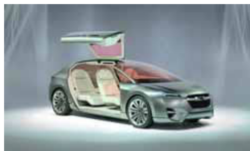
SUBARU HYBRID TOURER CONCEPT

スバルが提案する将来のグランドツーリングカーのコンセプトモデルです。流麗なフォルムの中に、スバルらしい「走行性能」や「安全性能」と、独特なハイブリッドシステムによる「環境性能」を高次元で融合させました。